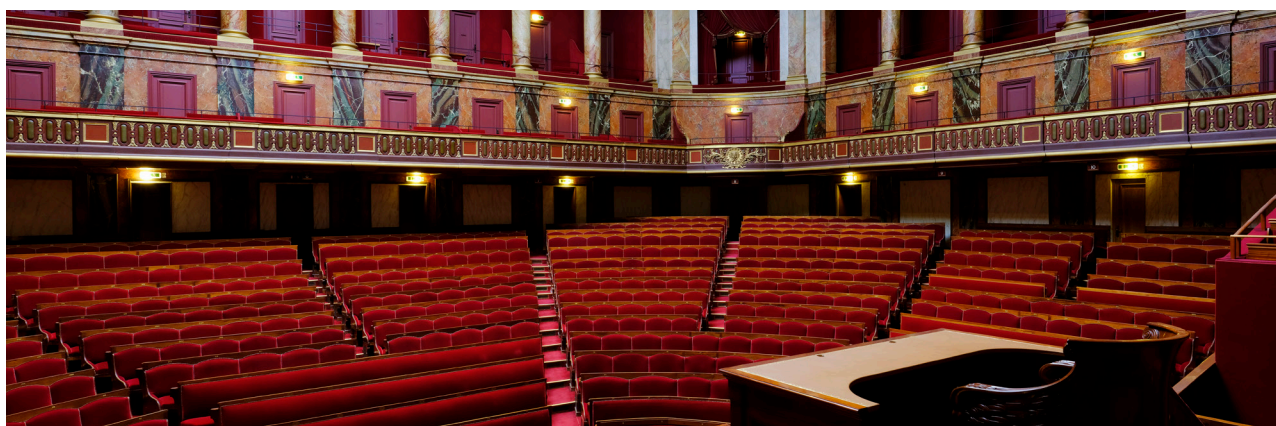
Salle du Congrès © Château de Versailles © Didier Sautinier

Le 4 avril, 250 jeunes du primaire au lycée investiront le château de Versailles dans le cadre du programme « enfants-conférenciers », coorganisé avec l'académie de Paris. En plus d'un parcours muséal dans la salle du Jeu de Paume lors duquel les élèves sont devenus médiateurs, les participants auront l'opportunité unique d'endosser le rôle de parlementaires en proposant et en débattant de propositions de lois dans la salle du Congrès, haut-lieu de la démocratie en France.