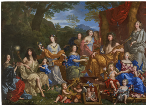
Jean Nocret, La Famille royale dans l'Olympe , vers 1670, huile sur toile

Initialement commandée par Philippe d'Orléans pour le château de Saint-Cloud, La Famille royale dans l'Olympe est aujourd'hui l'une des œuvres les plus emblématiques des collections de peintures du XVII e siècle du château de Versailles. Ce tableau aux dimensions imposantes - environ 12 m 2 - est par ailleurs le plus grand portrait français de cette époque nous étant parvenu. Peint en 1670, le tableau n'avait pas été décroché des boiseries de l'antichambre de l'Œil-de-Bœuf depuis 1984. Entre septembre 2022 et janvier 2024, grâce au mécénat de la Société des Amis de Versailles, une équipe de dix restaurateurs a mené une opération délicate visant la restauration de la couche picturale, du support en toile et le remplacement du lourd châssis en bois qui menaçait la toile. L'œuvre retrouvera sa place dans les boiseries de l'antichambre de l'Œil-de-Bœuf à l'issue de la restauration de cette dernière, à l'été 2024.