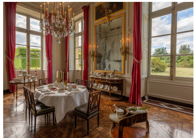
La petite salle à manger du Petit Trianon

Les visiteurs pourront découvrir les espaces de vie intime de la Reine, notamment sa chambre et son célèbre mobilier aux épis, le salon de Compagnie ou encore la salle à manger. Un service commandé par la Reine et probablement utilisé au Petit Trianon, 75 pièces en porcelaine acquises en 2023 par le château de Versailles, présentées sur une table dressée, permettent aujourd'hui de mieux percevoir l'atmosphère raffinée qui régnait à Trianon avant la Révolution.