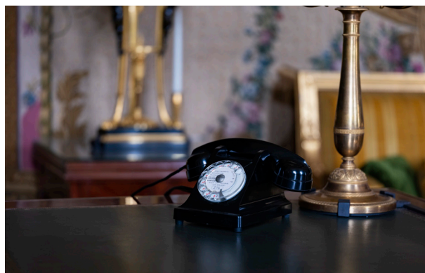
Téléphone dans le bureau du président