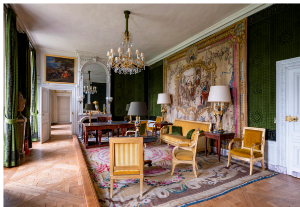
Le bureau du président