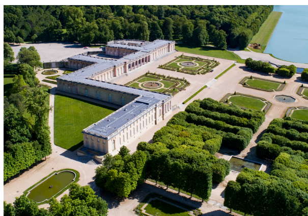
L'aile de Trianon-sous-Bois

L'ensemble du mobilier de l'aile de Trianon-sous-Bois a été restitué par le Mobilier national en 2015. L'aile se découvre donc dans son état des années 1960.