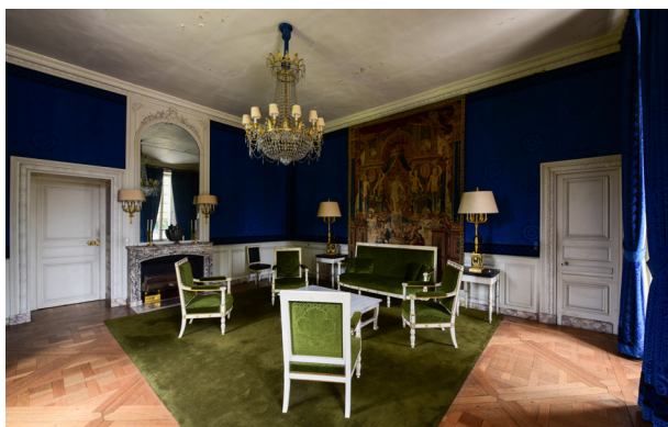
Le salon d'attente au rez-de-chaussée

Le projet prévoyait une importante restauration générale prenant en compte d'une part des considérations d'ordre logistique et pratique comme l'électricité et le chauffage, le palais étant devenu très vétuste, et d'autre part l'aménagement d'une résidence pour les hôtes étrangers de la France dans l'aile gauche et l'aménagement d'une résidence présidentielle privée dans l'aile droite, dite de Trianon-sous-Bois.