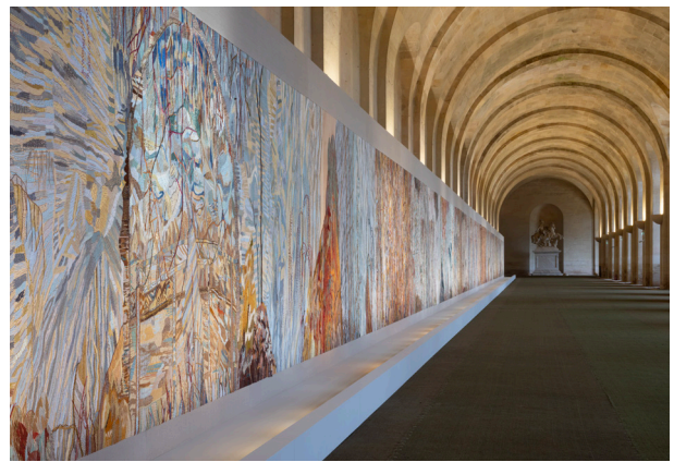
© château de Versailles / T. Garnier

Cet été, le château de Versailles invite l'artiste Eva Jospin à présenter son œuvre Chambre de soie lors de l'exposition Eva Jospin – Versailles à l'orangerie du château. Monumentale création de broderie de 350 m 2 et de 105 m de long, Chambre de soie ouvre un dialogue singulier avec l'imposante architecture de l'orangerie et invite le visiteur à la déambulation.