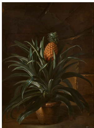
Ananas dans un pot, Jean-Baptiste Oudry, 1733, château de Versailles