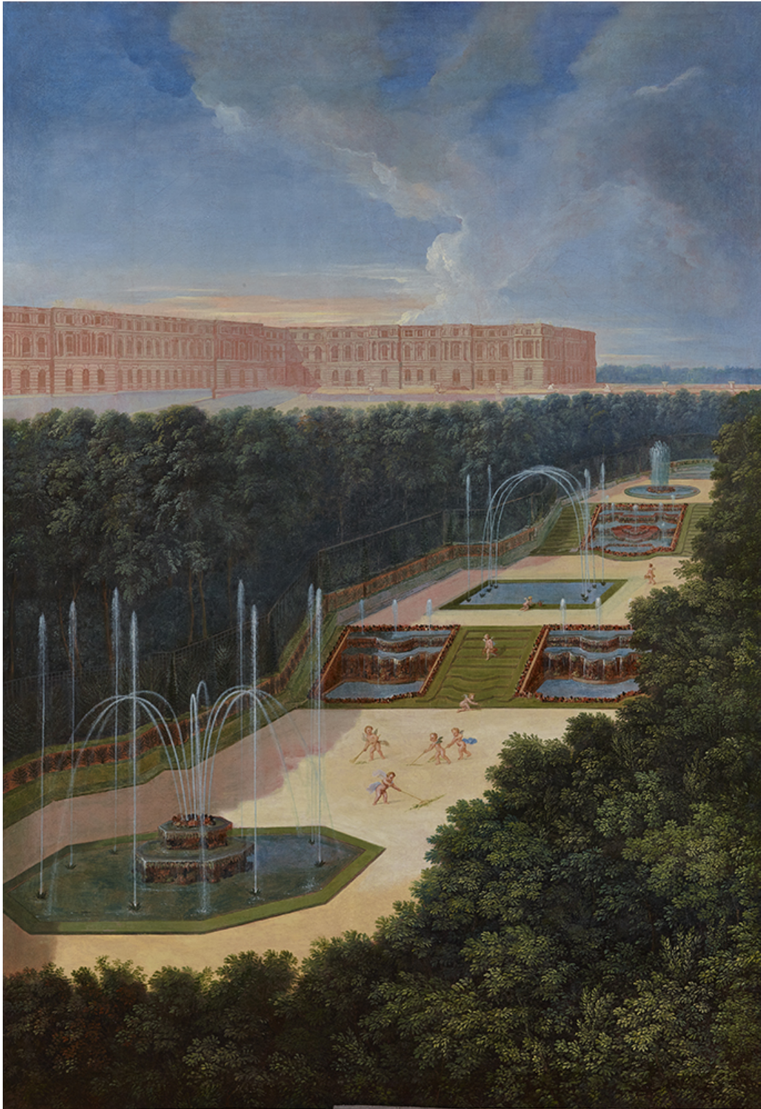
Vue du Bosquet des Trois Fontaines , par Jean Cotelle. XVII e siècle. Huile sur toile. 201 x 139 cm. Versailles, châteaux de Versailles et de Trianon. MV769.