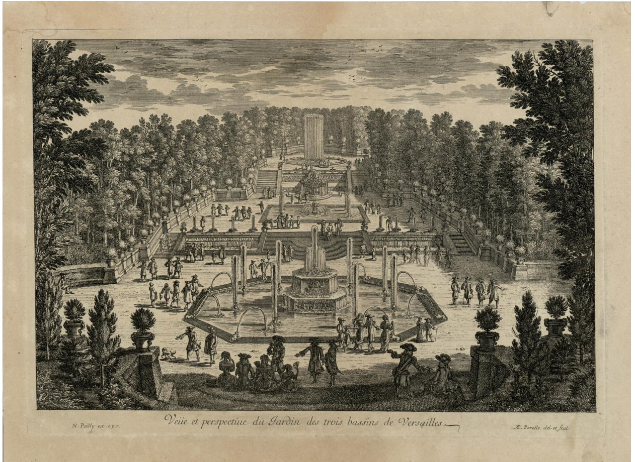
Le bosquet des Trois Fontaines dans les jardins de Versailles, par Famille Perelle (graveur). XVII e siècle. Estampe. 21,5 x 30,2 cm. Château de Versailles et de Trianon. Invgravares_grosseuvre_140_pl 124.