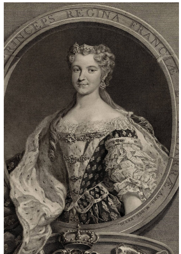
Maria poloniae princeps regina franciae et navarrae Laurent Cars le Fils (graveur) et Jean-Baptiste Van Loo (peintre) 1728

Marie Leszczinska régna 42 ans à la Cour de France. Elle fut la grand-mère de trois rois de France, et nombre de rois et de princes d'Europe ont des ancêtres qui lui sont apparentés.