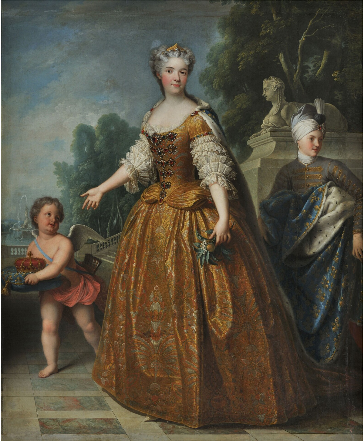
Marie Leszczyńska, reine de France , par François Stiémart, XVIII e siècle. Huile sur toile, 190,5 x 154,7 cm, Château de Versailles, MV 7683.