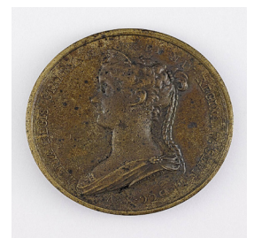
Mariage de Louis XV et Marie Leszczynska, 5 septembre 1725 Jean Duvivier, Médaille, INV.1850 7135