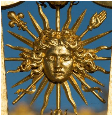
Venir au château de Versailles

Les inscriptions sont limitées à deux groupes maximum pour une même structure (dans la limite des places disponibles).