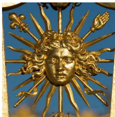
Venir au château de Versailles

Les inscriptions sont limitées à deux groupes maximum pour une même structure (dans la limite des places disponibles).